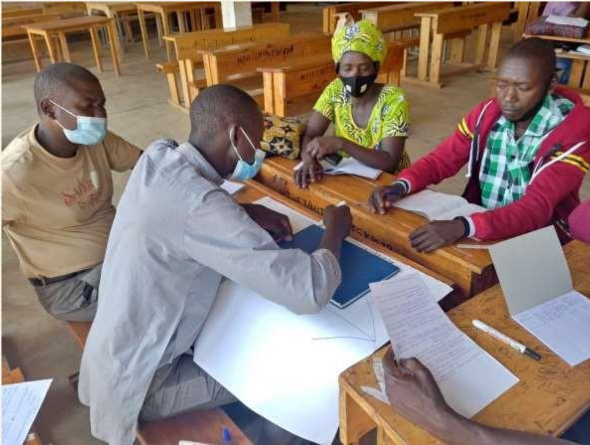
Ejemplo de lluvia de ideas en grupo durante un taller

Las entrevistas son una de las herramientas utilizadas para capitalizar. También existen otras herramientas para recabar información, como los talleres de debate en grupo y los cuestionarios.