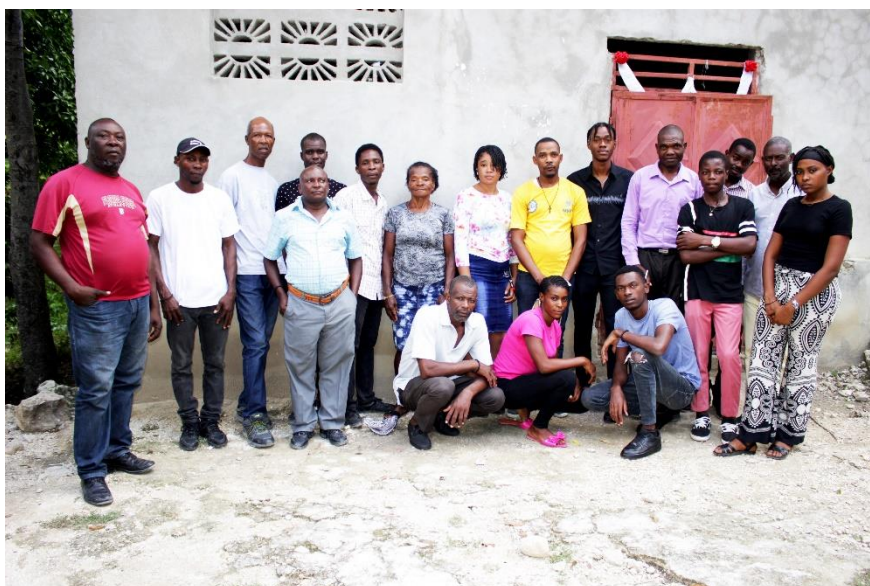
Le comité citoyen de Mi-haut 6 (Mirebalais)

Au fur et à mesure des actions menées sur leurs territoires, les comités citoyens ont tissé des relations de collaboration avec les acteurs institutionnels et associatifs présents dans leur environnement. Ces interactions prennent des formes diverses, allant de la participation conjointe à des activités communautaires, à la coordination autour d'actions spécifiques à fort impact local. Cette fiche vise à présenter la manière dont les comités citoyens se sont mis en lien avec d'autres acteur.ice.s du territoire.