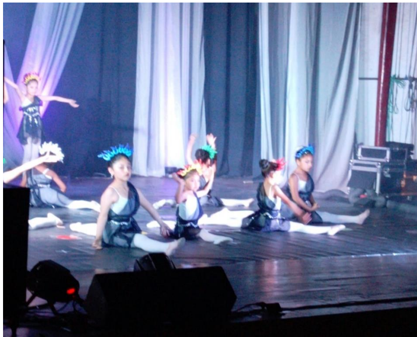
Espectáculo de danza de niñas acompañadas por el IPTK

De esta manera, se han abordado temas como la ruptura de las normas sociales que sostienen el sistema hegemónico, el cuestionamiento de la masculinidad hegemónica para dar paso a nuevas masculinidades más igualitarias y menos violentas, la promoción del diálogo intergeneracional y el fortalecimiento del rol de adolescentes y jóvenes como agentes del cambio social .