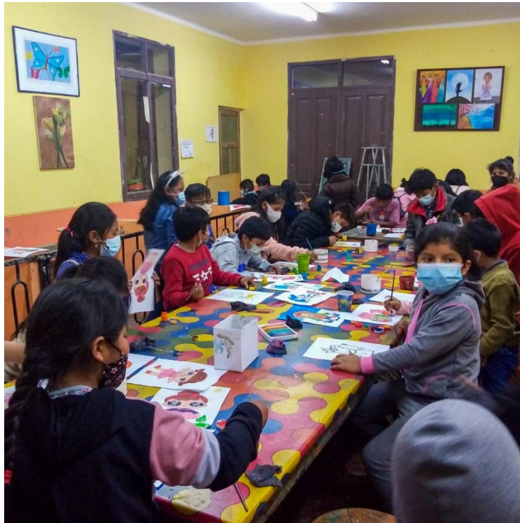
Taller de pintura en un CERPI

Los/las jóvenes que participan en los talleres son beneficiarios de los CERPI (Centros de Recursos Pedagógicos Integrales) en la zona urbana de Sucre y en otros municipios rurales. Los/las jóvenes pueden elegir las disciplinas artísticas que les interesen, son grupos mixtos entre niños y niñas.