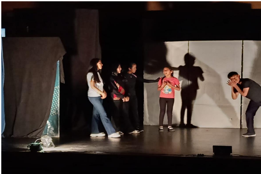
Espectáculo de teatro de los/las jóvenes acompañados/as por el IPTK

Las y los adolescentes y jóvenes, principales actores y actoras del cambio social