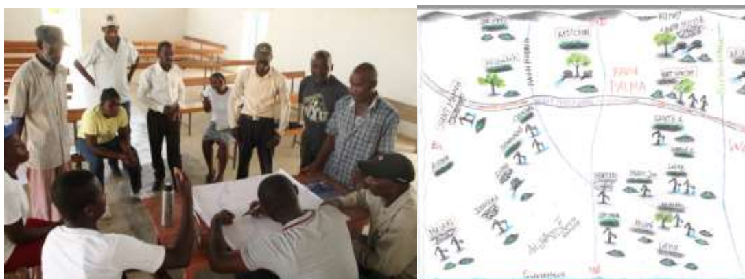
Arriba: dos fotos, por un lado el taller de cartografía de los recursos del territorio (puntos de agua, arboledas, zonas forestales, calidad del suelo) y por otro la esquematización que se hizo después

-otro ejemplo, el ejercicio de cartografía de su territorio, que permitió tomar conciencia de los recursos disponibles en el territorio y de su desigual distribución