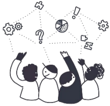
Ficha de diagnóstico